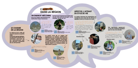
Panneaux de l'exposition.

L'exposition évoque aussi le lien historique avec l'héritage anglophone de Pau issue des XIXe et XXe siècles. Grâce à la place accordée aux témoignages, elle rend compte des motivations contemporaines de cette installation de populations anglophones, parfois liées à l'idylle rural représenté par la région, par son paysage, mais aussi à l'amour, à l'attrait pour la culture, à la langue et au mode de vie.