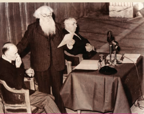
François Mauriac, Francis Jammes et Paul Claudel à la tribune du Théâtre des Champs-Élysées - 25 octobre 1937